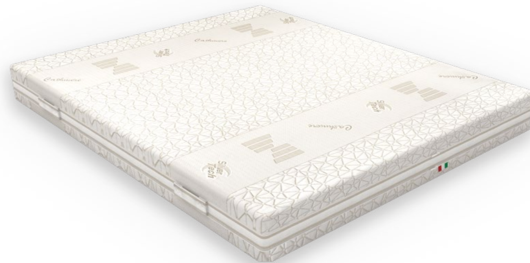
MAXQUANO Materac z pokrowcem Kaszmir i Silver Tech